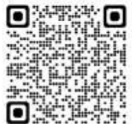
สิ่งที่ส่งมาด้วย ๒